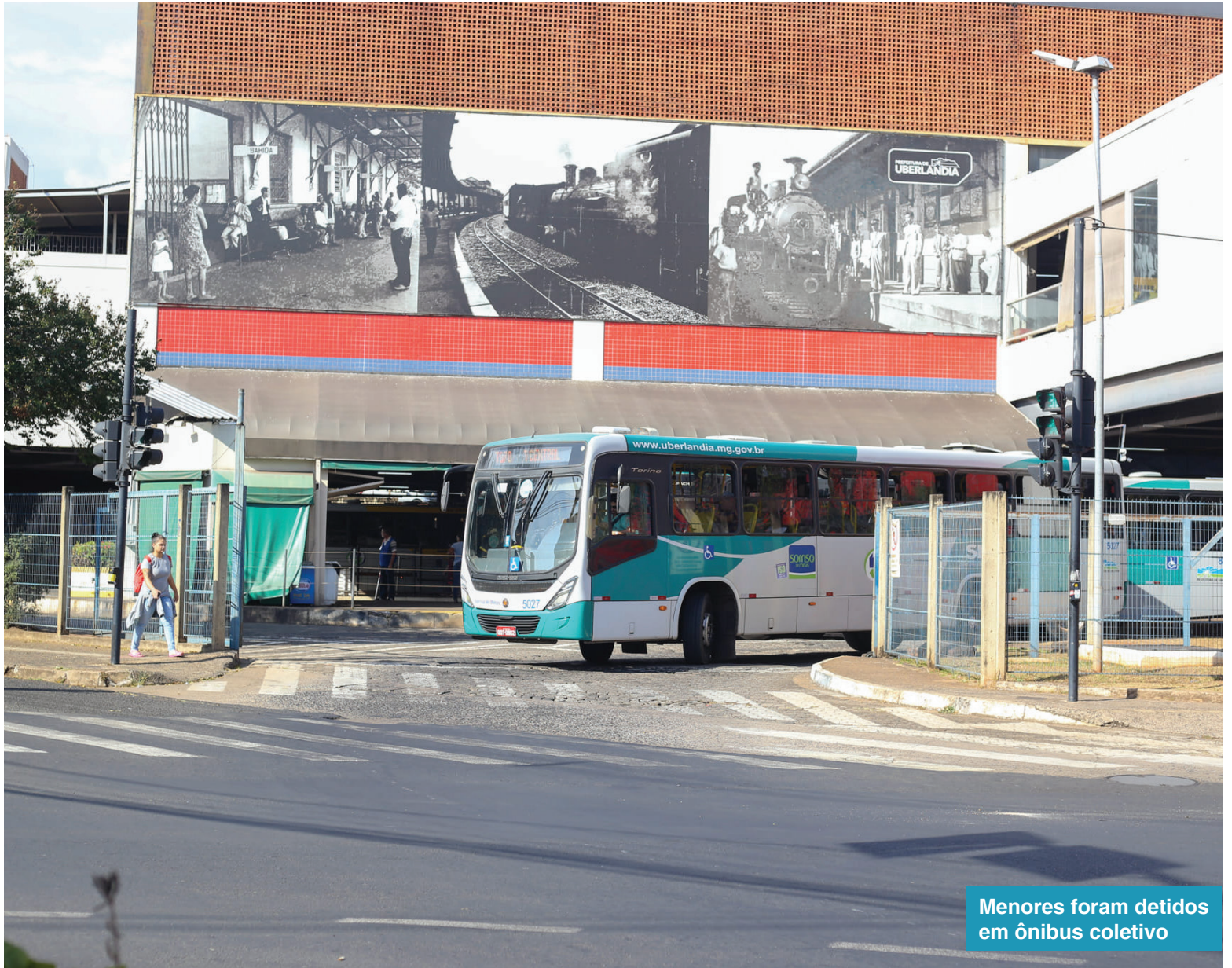
Menores foram detidos em ônibus coletivo