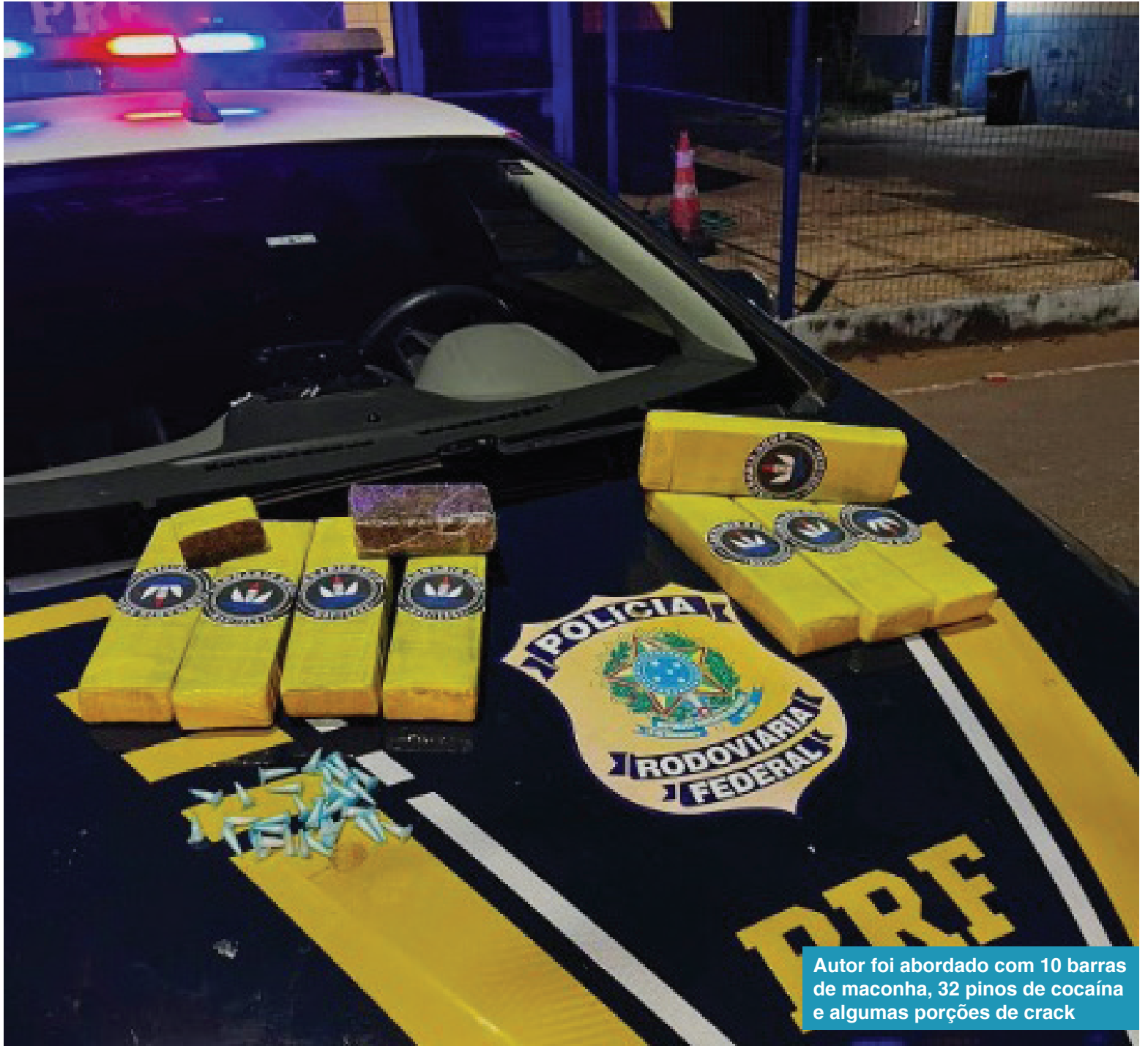
Autor foi abordado com 10 barras de maconha, 32 pinos de cocaína e algumas porções de crack